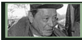
Manuel Marulanda – el líder de La FARC

El grupo guerrillero más grande, antiguo, rico y definido en Colombia, se hace llamar el ejército del pueblo por su proclividad a pensar que protegen a la gente campesina. La FARC empezó durante los años 40 con la idea de suceder al país de Colombia por no estar de acuerdo con la política de esa época, una dictadura militar. En la época de “La Violencia” (1948-58), la guerra civil entre la gente y la dictadura de Colombia, existieron los que estaban en contra de capitalismo y que tenían ideas basadas en comunismo y marxismo. Después de la guerra, ellos tomaron control del Sur del país con 1.000 miembros y empezaron a llamarse la FARC.