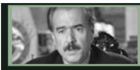
Presidente de Colombia Andrés Pastrana (1998-2002)

El plan, como fue escrito por el gobierno del presidente Andrés Pastrana de Colombia en 1999, es un documento de 20 páginas que contiene 10 estrategias para combatir el narcotráfico, devolver poder a los ciudadanos de Colombia, reducir el cultivo de la cocaína, crear empleo y negociar con las guerrillas. Es un plan cuyo objetivo es la paz a través del mejoramiento de los problemas socioeconómicos. En general, el quería que plan fortaleciera el estado y promoviera la paz y la prosperidad de Colombia.