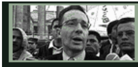
Presidente de Colombia Álvaro Uribe Vélez

En 2000, Estados Unidos escojo su nuevo presidente, George W. Bush, y en 2001, un año después de la implementación del plan, Rand Beers, asistente de narcóticos internacional entregó un informe al senado de EE.UU. para proveer una evaluación inicial de la asistencia a Colombia. Él les dijo que inicialmente, había habido progreso y que paulatinamente, el país continuaría progresando a favor de lo que querían los gobiernos de ambos países. Él comunicó que había estado un aumento en las cosechas de la cocaína por 11% de 122.500 hectáreas en 1999 a 136.200 hectáreas en 2000, pero que este aumento fue el incremento más pequeño en más de 5 años. Además, él entregó información acerca de la ayuda militar y los programas socioeconómicos que EE.UU. estaba respaldando en la región andina. Sobre todo, su tono y sus palabras reflexionaron la esperanza que mantenían para Colombia.