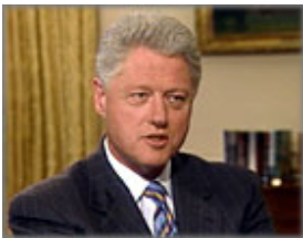
Presidente de Estados Unidos Bill Clinton (1992-2000)

“Claro está, el Plan Colombia también fortalecerá nuestros esfuerzos comunes por combatir la droga y los narcotraficantes que aterrorizan a nuestras dos naciones. Pero les ruego que no interpreten mal nuestro propósito. Nuestro objetivo no es militar. No creemos que su conflicto tenga una solución militar. Apoyamos el proceso de paz. Nuestro enfoque en tanto pro-paz como anti-droga”.